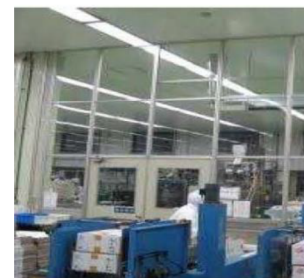
空気を經由した汚染の防止設備（パーティション）の導入