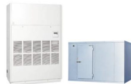
温度管理を要する装置・設備の導入