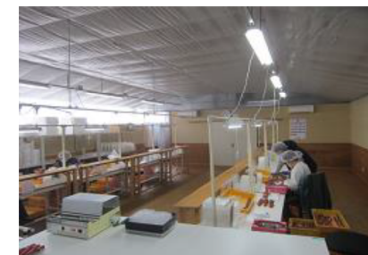
パッキング設備の導入