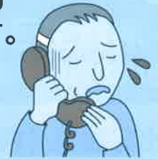
(消費者庁イラスト集より)

被害者は、高齢者に多く、自宅の固定電話に犯人からの電話がかかってきたことをきっかけに被害にあっています。